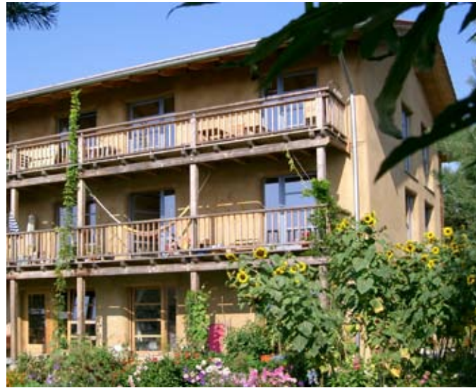
Bj. 2005 , lehmverputzt, 3-geschossig: "Strohpolis"

Baustrohballen sind landwirtschaftlich hergestellte Ballen aus unbehandeltem, naturbelassenem Getreidestroh. Damit diese den gesetzlichen Bestimmungen entsprechend als Baustoff, genauer gesagt als Wärmedämmstoff eingesetzt werden können, müssen sie der allgemeinen bauaufsichtlichen Zulassung Z-23.11-1595 entsprechen und von einem güteüberwachten Hersteller stammen. Als europaweit erstes Herstellerunternehmen stellt die Firma BauStroh Limited aus Norddeutschland Baustrohballen als anerkannten Dämmstoff zur Verfügung.