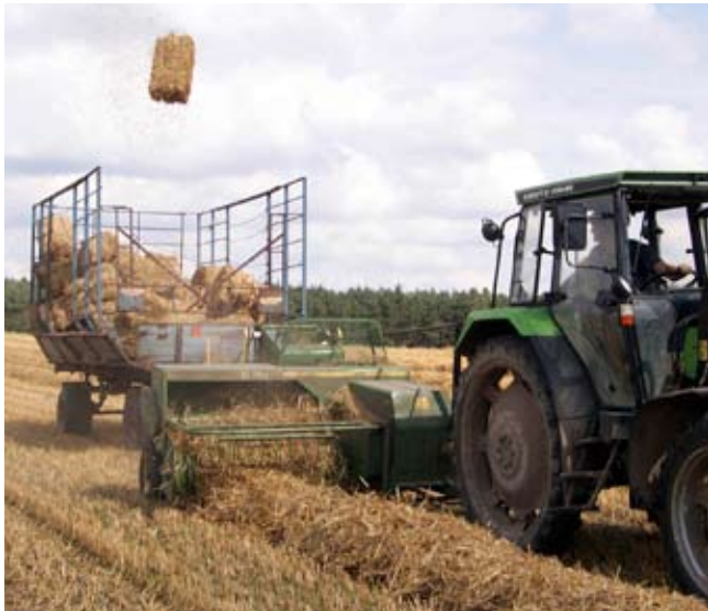
Landwirtschaftsübliche Herstellung von Kleinballen

Der Vorteil an Strohballen ist die einfache Herstellung und die weitgehende regionale Verfügbarkeit. Auf bis zu 50% der bundesdeutschen Ackerflächen wächst Getreide- unser täglich Brot. Etwa 20% von dem nebenbei anfallenden Stroh stehen zur freien Verfügung- ein Baustoff der einfach schon da ist- ohne weiteren Herstellungs- und Energieaufwand und zusätzliche Umweltbelastungen. Dies hilft auch Baukosten zu senken, denn Baustrohballen sind derzeit der günstigste anerkannte Naturdämmstoff. Diesem Potential fühlen wir uns verpflichtet. Die gesamte Bereitstellung des Baustoffs, die Weiterverarbeitung und die Gebäude selbst setzen diesen Kurs konsequent fort.