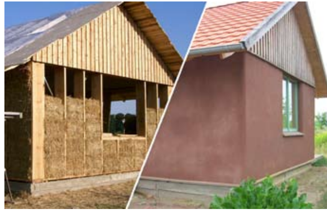
Baujahr 2005, lehmverputzt

Die Herstellung der Ballen unterliegt der strengen Qualitätskontrolle durch ein akkreditiertes Fremdüberwachungsinstitut.