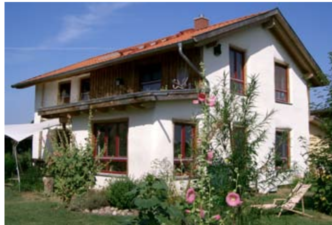
Baujahr 2003, kalkverputzt/ teilweise holzverkleidet

Fachverband Strohballenbau Deutschland e.V.: www.fasba.de