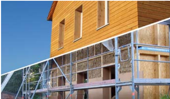
Baujahr 2006, Strohballengedämmter Holzrahmenbau, gemäß Z-23.11-1595

Mit Strohballen lassen sich auf einfache Weise hochwärme- gedämmte, umweltfreundliche Wohnhäuser erstellen. Dabei werden Strohballen als dämmende Ausfuchung in ein Holzständerwerk eingesetzt und verputzt/ verkleidet. Weltweit gehören Strohballenbauten in vielen Ländern wie den USA, Kanada, Australien fast schon zum Alltag. Hunderte von gebauten Beispielen, einige 100 Jahre alt, beweisen: Mit dieser Bauweise lassen sich kostengünstig haltbare, gesunde, mehrgeschossige Bauten errichten. Auch in Europa beispielsweise in Frankreich, England, Holland, Österreich, der Schweiz und Dänemark hat diese neue Bauweise mittlerweile Fuß gefasst. In Deutschland wächst seit einigen Jahren das Interesse am Strohballenbau. Seit 2006 liefert BauStroh bundesweit zugelassene Baustrohballen.