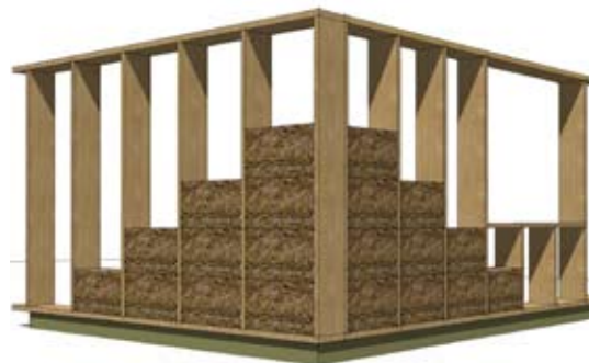
Ausfuchung, e ≤ 1,0m

Ursprünglich wurden Strohballen sogar als lasttragende "Mauersteine" eingesetzt. Hierzulande fehlt für diese Bauweise noch der bauaufsichtliche Nachweis. Bestens bewährt und bauaufsichtlich anerkannt, ist jedoch die Verwendung der Strohballen als dämmende Ausfuchung in einer Holzkonstruktion. Hierbei werden die Ballen mit einer Dicke zwischen 28 und 50 cm in ein abgestimmtes Rahmenwerk lückenlos eingepresst. Einem fachgerecht ausgeführten Strohballenbauteil können Ungeziefer, Schädlinge, Feuer und Feuchte nichts anhaben. Dabei kommt das Material ohne jegliche Zusätze aus- ein Vorteil für Gesundheit und Umwelt.